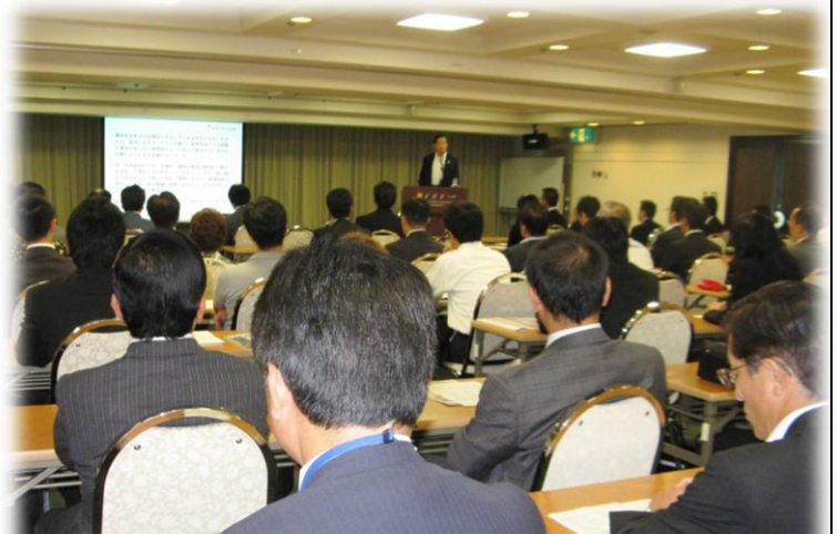
80名が参加した講演会(チサンホテル心斎橋)

大阪には、まだまだ眠っている観光資源がある。水都大阪の復活、これは八軒家浜の水辺整備のようにきっかけがあればできる。大阪城、OSK 日本歌劇団、大阪市中央卸売市場、新清水寺(天王寺区の