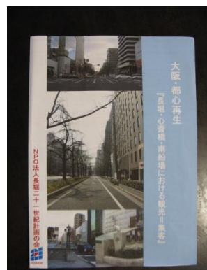
まちづくり提言書