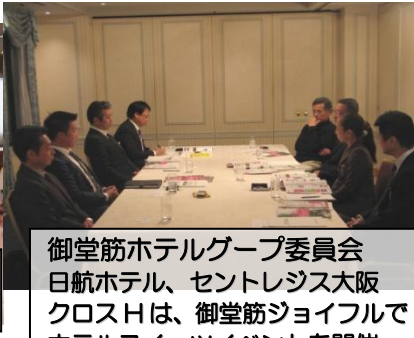
御堂筋ホテルグループ委員会 日航ホテル、セントレジス大阪 クロスHは、御堂筋ジョイフルで ホテルスイーツイベントを開催