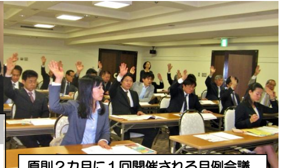
原則2カ月に1回開催される月例会議