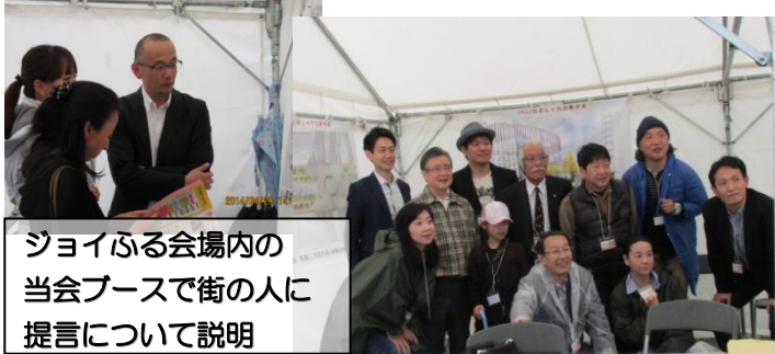
ジョイふる会場内の 当会ブースで街の人に 提言について説明

2014 御堂筋ジョイふる (4月29日) 御堂筋開放は、この会が仕掛け人。2003年、当会のイベント「アートフリンジフェスティバル」がきっかけになった。