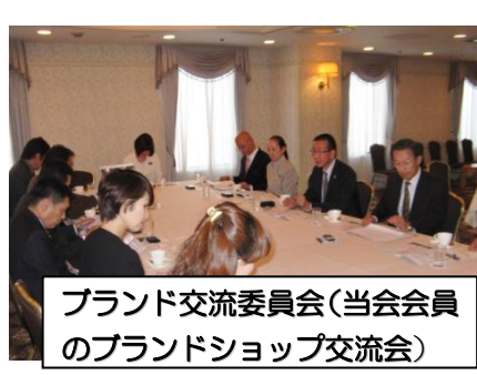
ブランド交流委員会(当会会員のブランドショップ交流会)